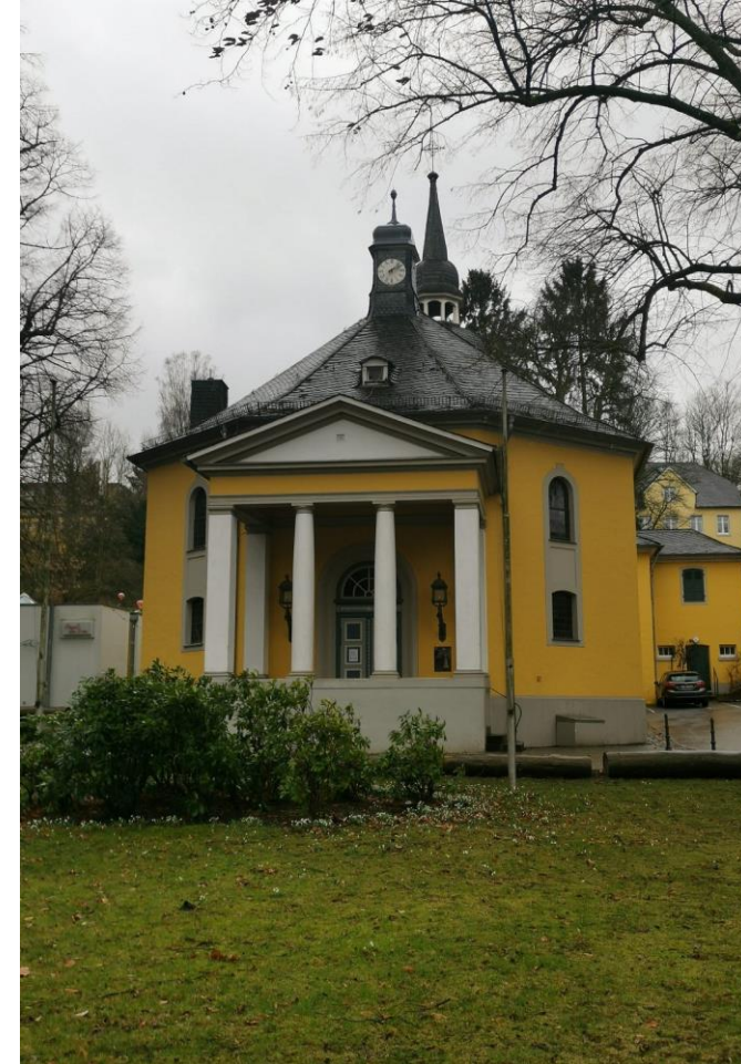
Gnadenkirche Bergisch Gladbach