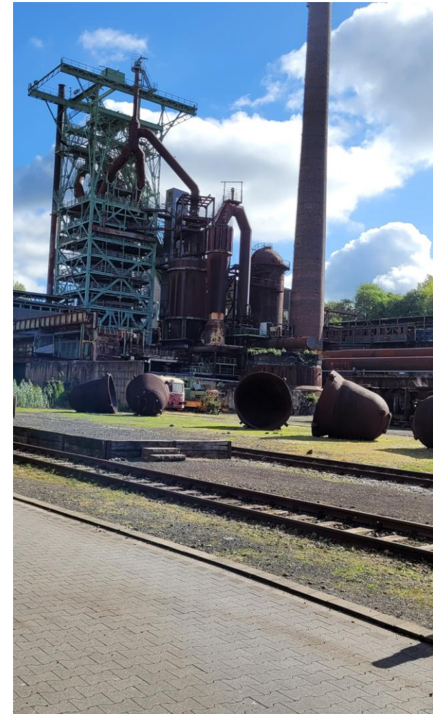
Henrichshütte in Hattingen

Zu allen Veranstaltungen wird gesondert eingeladen. Programmänderungen vorbehalten!